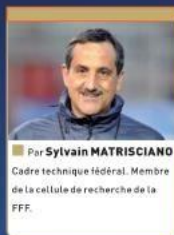
Par Sylvain MATRISCIANO Cadre technique fédéral. Membre de la cellule de recherche de la FFF.