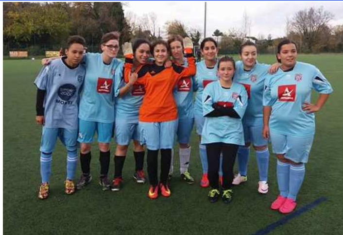
UN EXEMPLE A SUIVRE : L'EQUIPE FEMININE CREEE CETTE ANNEE AU SEIN DU CLUB D'ENTRAIGUES ET PARTICIPANT AU CHAMPIONNAT FEMININ 2EME DIVISION A 8.

En début de saison, le Président du District Rhône-Durance avait tenu, une nouvelle fois, à souligner sa volonté d'accroître au sein du district une politique en faveur de la féminisation des clubs. Cette volonté paraît aujourd'hui pleinement partagée par les dirigeants des Clubs, puisque nous pouvons nous féliciter de compter dans le district, en catégorie seniors féminine à 8 : 25 équipes, en U17 féminine 15 équipes et enfin en U14 féminine 12 équipes... Ces chiffres sont en progression constante. Formons l'espoir, nous membres de la commission des arbitres, que parmi ces licenciées du ballon rond, certaines auront, au cours de leur parcours footballistique, l'envie de rejoindre un jour le corps arbitral.